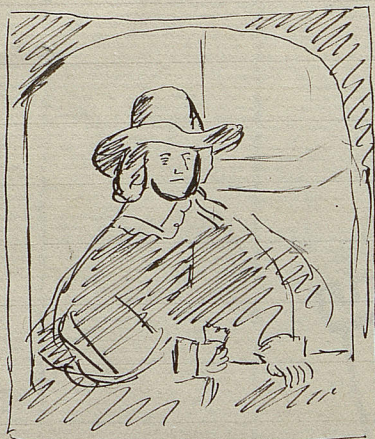
Rembrandt 1641 (Portrait d'homme)

Je suis possesseur de plusieurs tableaux, et c'est à tort que dans la dernière lettre que je vous ai écrite, je vous signalais un Van-Dyck (portant l'un Daignem). Ce Van-Dyck néanmoins n'est autre que le Portrait d'homme (1641) de Rembrandt que vous possédez dans votre Musée. Reste à savoir quel est celui des deux qui a été le premier peint. Le votre est signé et daté, le mien ne l'est pas, et, pourtant l'opinion du Musée des Beaux-Arts, à Bruxelles, a été de même. Ayant l'intention d'aller voir ce tableau à Bruxelles, je vous demanderais s'il m'aurait permis de le voir et, en même temps, j'acquiescerai la photographie de votre dessin à étudier sur place les quelques différences qui peuvent exister entre les deux toiles. (Je vous trace sur le papier la pose du dit portrait pour vous aider à vous souvenir de dit tableau)